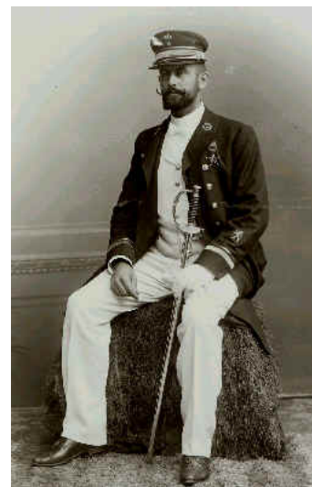
Knud Jespersen sfotografowany w Rønne, 1905

Jespersen awansował przez wszystkie stopnie oficerskie: porucznik, kapitan, zastępca dowódcy okręgu i w końcu dowódca okręgu. W tym czasie otrzymał 6 orderów.