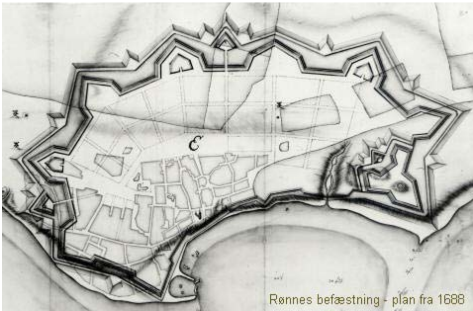
Rønnes befæstning - plan fra 1688

Bornholm og i Malmö fungerede sideløbende, men uafhængigt af hinanden. I modsætning til det der skete på Bornholm, udviklede sammensværgelsen i Malmö sig til en katastrofe. Dette hænger sammen med, at den svenske efterretningstjeneste fik kendskab til, hvad der var under optræk i Skåne. Malmösammensværgelsen blev således oprullet, de ledende folk blev halshugget og det lykkedes at bekæmpe ethvert oprørsforsøg. Ifølge samtidige kilder var den bornholmske opstand foregået uden større tab af menneskeliv. Så vidt man ved, var det "blot" nogle få svenskere, der måtte lade livet. I den såkaldte Printzensköldvise, et sagn om drabet og