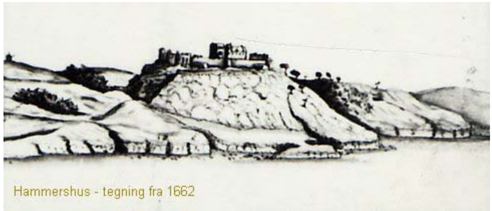
Hammershus - tegning fra 1662